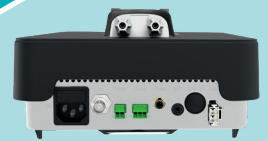
„Plug & Play“-Anschluss