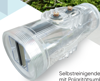
Selbstreinigende Zelle mit Polaritätsumkehr